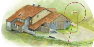
Le drapeau levé signale l'ouverture du bâtiment.

OUVERTURE de 10h à 18h tous les jours en juillet - août & tous les week-ends du 15 mai au 30 juin et du 1 er sept. au 15 oct. En dehors de cette période, téléphonez au 03 89 82 20 12