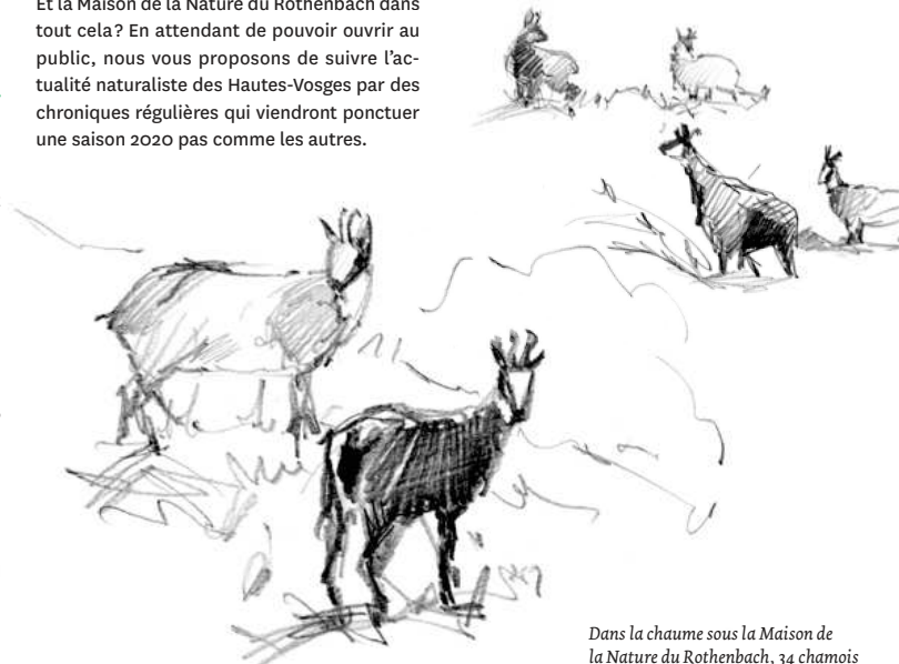
Dans la chaume sous la Maison de la Nature du Rothenbach, 34 chamois sont rassemblés ce jour-là.

Et la Maison de la Nature du Rothenbach dans tout cela? En attendant de pouvoir ouvrir au public, nous vous proposons de suivre l'actualité naturaliste des Hautes-Vosges par des chroniques régulières qui viendront ponctuer une saison 2020 pas comme les autres.