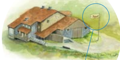
Le drapeau levé signale l'ouverture du bâtiment.

OUVERTURE de 10h à 18h tous les jours de juillet à septembre & tous les week-ends du 15 mai au 30 juin et du 1 er sept. au 15 oct. En dehors de cette période, téléphonez au 03 89 82 20 12.