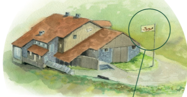
Le drapeau levé signale l'ouverture du bâtiment.

OUVERTURE de 10h à 18h tous les jours en juillet-août & tous les week-ends du 15 mai au 30 juin et du 1 er septembre au 15 octobre. En dehors de cette période, téléphonez au 03 89 82 20 12.