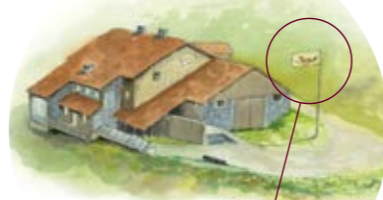
Le drapeau levé signale l'ouverture du bâtiment.

OUVERTURE de 10h à 18h tous les jours de juillet à septembre & tous les week-ends du 15 mai au 30 juin et du 1 er au 15 octobre. En dehors de cette période, téléphonez au 03 89 82 20 12.