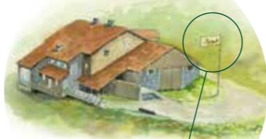
Le drapeau levé signale l'ouverture du bâtiment.

OUVERTURE de 10h à 18h tous les jours en juillet-août & tous les week-ends du 15 mai au 30 juin et du 1 er septembre au 15 octobre. En dehors de cette période, téléphonez au 03 89 82 20 12.